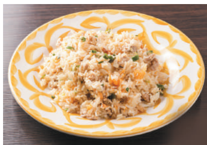
ピッキーヌーチャーハン タイの青唐辛子と卵でシンプルに