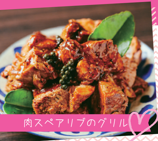
肉スペアリブのグリル