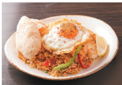
ナシゴレン エビの旨味たっぷり