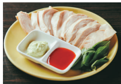
カオマンガイ 鶏の蒸し肉と炊き込みごはん