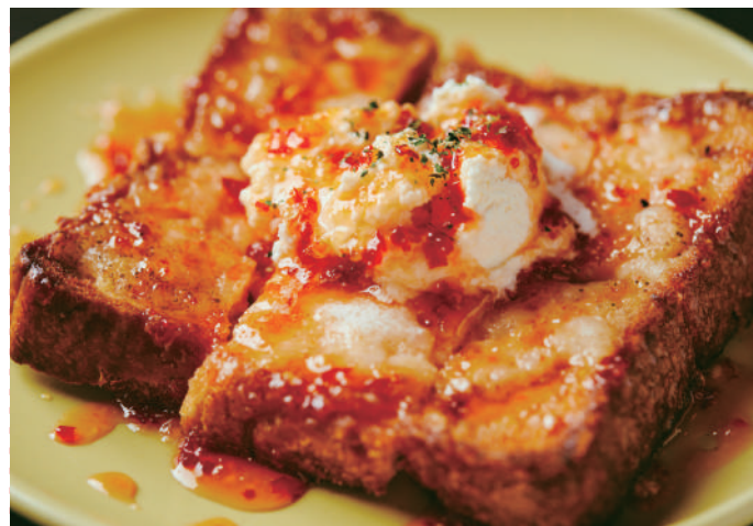
エビトーストwithホイップバター